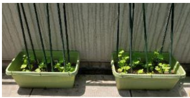
6月2日の様子。本葉が少しずつ増えてきました。

2階ロビーのベランダで、夏の日差しを受けて、ぐんぐん成長中。果実の収穫が楽しみです。ぜひ成長を見守ってあげてください。