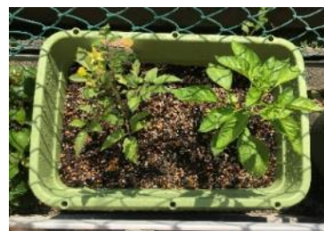
(左より)ミニトマト、ピーマン

育てていく様子を楽しむことができ、自宅で栽培した野菜をそのまま食卓で味わうことができます。初心者でも簡単に育てられる野菜もいろいろあるので、気軽に家庭菜園を初めてみてはいかがでしょうか。7月はオクラやチンゲン菜がおすすめです。