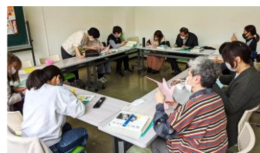
↑以前実施したお楽しみ会の様子

日本語が分からないことで、日常生活に困っている人であれば、日本人でも外国人でも自由に日本語を学ぶことができます。日本語の勉強以外に遠足に行ったり、料理を作ったりして交流もしています。日本語の勉強をしたい人は、生涯学習市民センターに電話で問い合わせるか、直接お越しください。また、あなたの周りに日本語が分からなくて困っている人がいらっしゃったら、このよみかき教室のことを教えてあげてください。