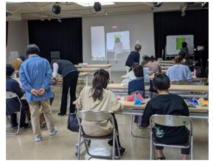
2021年3月に開催した折り紙講座より

生涯学習市民センターの利用団体関係、生涯学習市民センターの事業に関心のある方、地域活動に意欲のある方など、一緒に活動しませんか。活動予定やご質問はセンター事務室まで、お気軽にお問合せください。