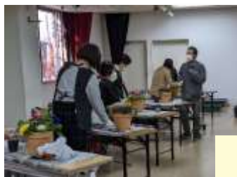
「冬の寄せ植え」 クリスマスからお正月まで映える華やかな花々で寄せ植え作り。