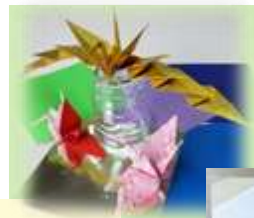
「レインボー鶴を折りませんか」 虹のアーチのように羽を優雅に広げる折り鶴を折りました。