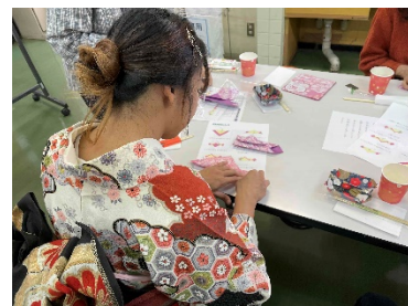
★2023年12月の お楽しみ会のご様子