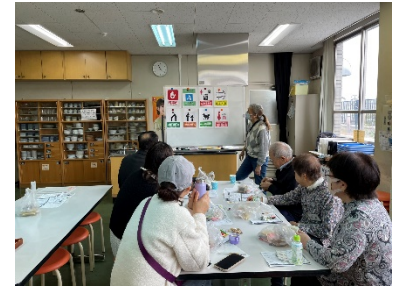
★写真は、3月の 防災学習の様子